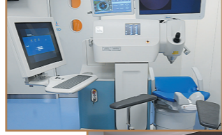
レーザー白内障手術装置の入力画面。光学式バイオリンで計測したデータ(眼球の大きさや角膜の角度などをインプットして、患者ごとに最適な手術計画を作成する。