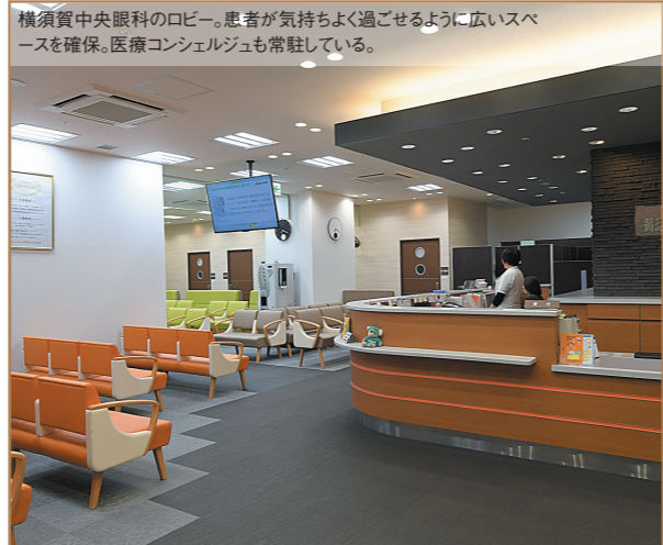
横須賀中央眼科のロビー。患者が気持ちよく過ごせるように広いスペースを確保。医療コンシェルジュも常駐している。

眼内レンズには遠くか近くのどちらか一方に焦点を合わせた単焦点レンズと、その両方に焦点を合わせた多焦点レンズがある。多焦点レンズはメガネへの依存がかなり減少するので大変に便利だが、複雑な構造をしているため、より正確な位置に挿入しなければならぬ。精度の高いレーザー手術であれば、それが容易になるのだ。