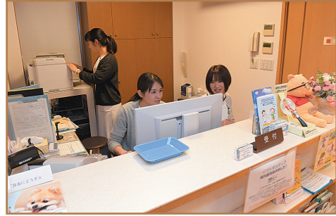
上: JR鶴見駅に隣接するビルの1階にある横浜鶴見中央眼科。「世界レベルの医療を横浜鶴見で」をモットーとしている。 下: 衣笠中央眼科はJR衣笠駅から車で5分程度。横須賀中央眼科との強い連携で先進の医療を受ける事が出来る。