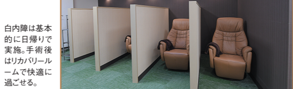
白内障は基本的に日帰り実施。手術後はリカバールームで快適に過ごせる。

「多焦点レンズは設置場所が目の真ん中からズレるとその影響を受けやすいデリケートな構造をしています。これがレーザーならより正確で再現性の高い手術ができます。進行した重度の白内障は手術の難易度が上がりますが、そういった白内障