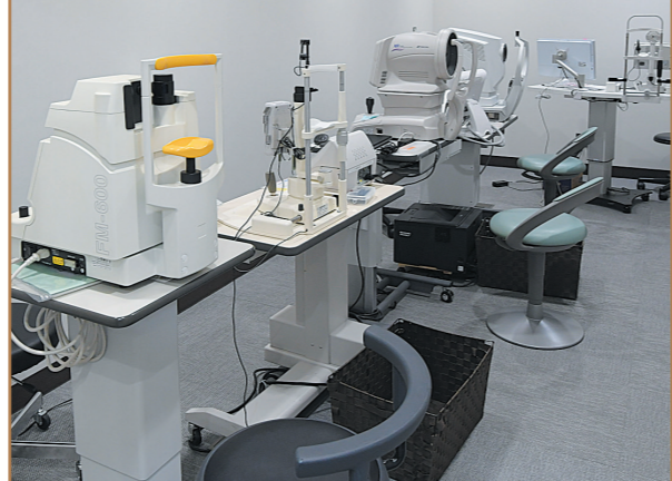
目の断面図などを見ることができると診断するための検査機器も充実。